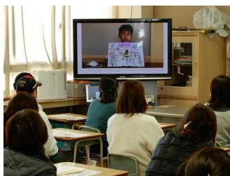
4年：ドリームマップ ～夢を語る～