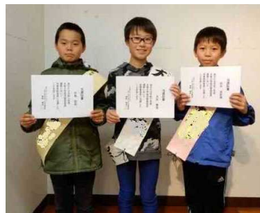
当選証書を受け取って