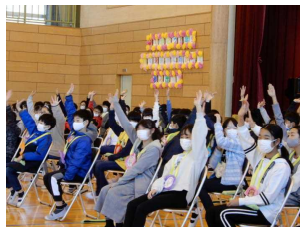
クイズに答える6年生