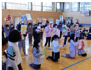
3年生からのメッセージ

6年生には、卒業する喜びと希望を胸に、残された小学校生活を最後まで充実させてほしいと思います。