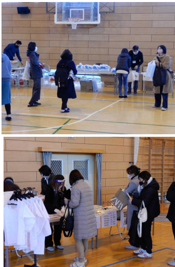
説明会後の物品販売