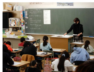
3年：わかりやすいように整理しよう