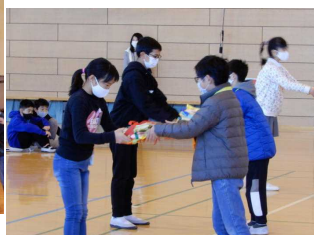
在校生から6年生へプレゼント