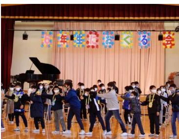
5. 6年生が一緒にダンス!