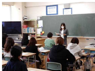
5年：思い出の林間学校