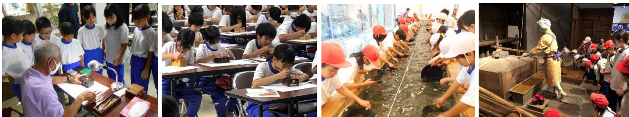
はんこ職人さんの話を傾聴、てん刻や砂金採集に挑戦…伝統や歴史を体験。