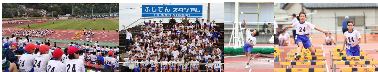
大里小は午後の部に出場。集まった14校の6年生が、自分の記録に挑戦しました。